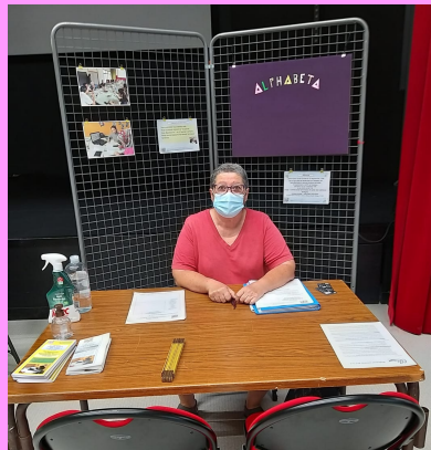
Leuville sur Orge

ALPHAbétisation au profit des habitants de Brétigny ET Alentours – Association loi 1901 – JO du 19/12/1998 – SIREN 528 691 736